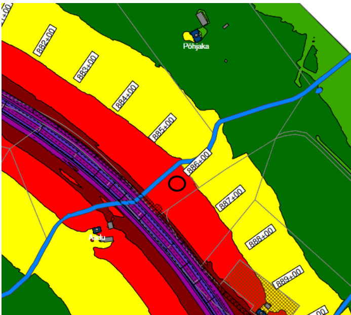
Joonis 2. Väljavõte eelprojekti mürauringust, öine müratase

Lähtudes eeltoodust taotleb Transpordiamet Paide Linnavalitsuselt ehitisregistri koodiga nr 107013864 seotud haldusaktide (sh haldusaktid nr 2212994/00442, 2212994/00900) tühistamist ning soovib olla teemaplaneeringu ja ehitusseadustiku alusel kaasatud Vesiveski kinnisasjaga seotud uutesse haldusmenetlustesse.